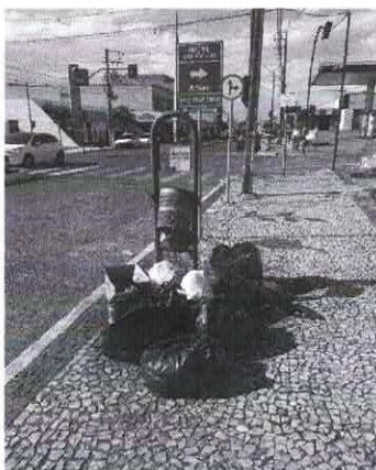
Av. Ozy Mendonça de Lima