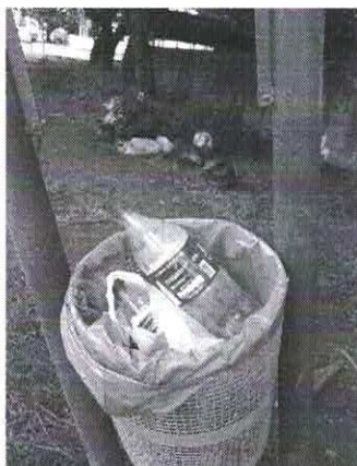
Em frente a Clargel Embalagens