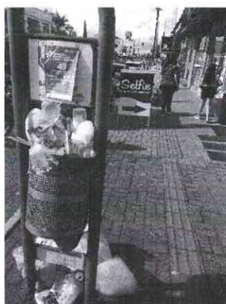
Av. Ozy Mendonça de Lima