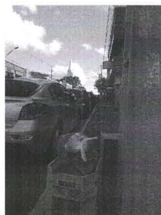
Av. Ozy Mendonça de Lima