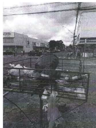
Rua Dom Pedro II